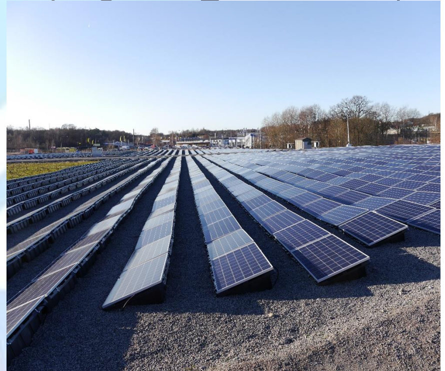
Ühistuline päikesepark Karlskronas, Rootsi 2020 (Co2mmunity)

Nõustamiskeskus huvilistele, energiaühistutele, energiakogukondadele ja algatustele